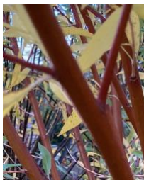
Fűz: váltakozón nővő hajtások